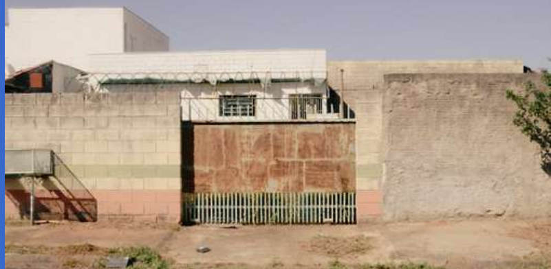
Antigo prédio do Armazém das Artes

O espaço poderá receber apresentações artísticas de todos os tipos, desde peças teatrais, musicais, danças, shows e palestras. O Teatro da Câmara será um importante instrumento para fomentar a arte e a educação na região.