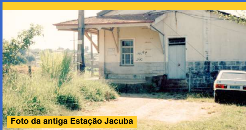
Foto da antiga Estação Jacuba

O museu é um lugar de educação, lazer e cidadania, que oferece aos visitantes uma oportunidade de conhecer melhor a história de Hortolândia e se identificar com ela. A entrada é gratuita.