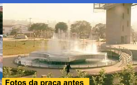
Fotos da praça antes da revitalização